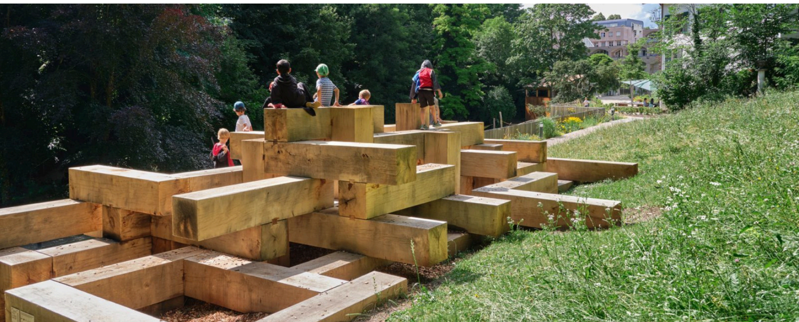
Les Frères Chapuisat, Charpentification , 2021

L'action des Nouveaux Commanditaires permet à des citoyennes qui veulent améliorer leur cadre de vie, changer une situation ou transmettre les valeurs qui les animent, d'associer une artiste à leurs préoccupations en lui passant commande d'un projet artistique. Ce processus d'environ 3 ans a été lancé cette année et déjà plusieurs réunions ont eu lieu entre 8 paysannes et une facilitatrice. Le sujet porté par le groupe de participantes est celui de la surcharge paysanne et la non-valorisation du travail agricole. Il aboutira à une œuvre d'art accessible au public dont seules les participantes peuvent prédire la forme.