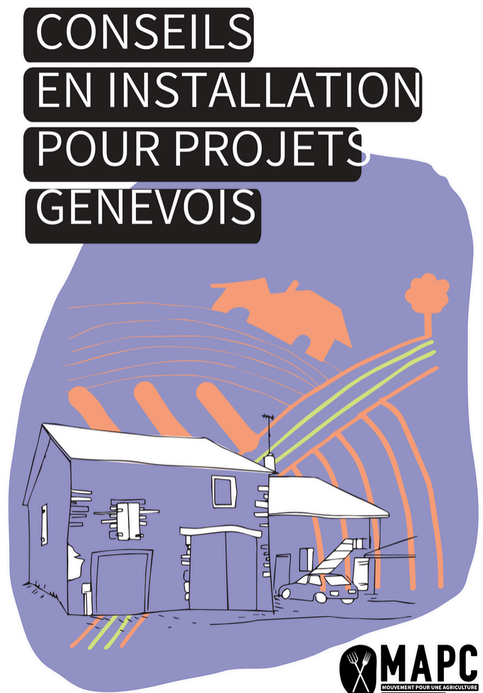
Table ronde « Quelles voies pour une pratique paysanne de l'agriculture à Genève ? (14 octobre) »

Une analyse de la propriété du foncier agricole du territoire genevois a aussi été réalisée afin de comprendre le paysage de la propriété, entre terres publiques et terres privées, et lesquelles de ces dernières sont en fermages ou en propriétés des agriculteur-x-ices. La synthèse des résultats est prévue pour 2026.